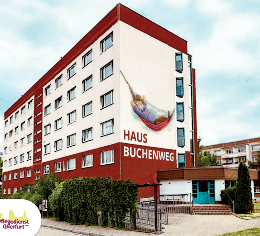
VISUALISIERUNG DER GEPLANTEN FASSADENGESTALTUNG